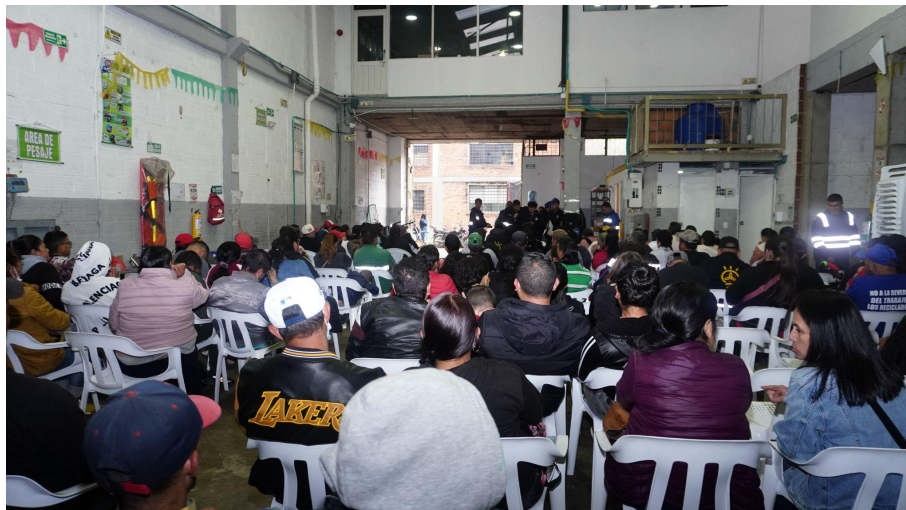
Fotografía 2. Taller de fortalecimiento 2022.