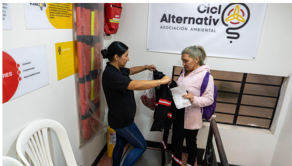
Fotografía 6. Entrega de dotación a recicladores de oficio.