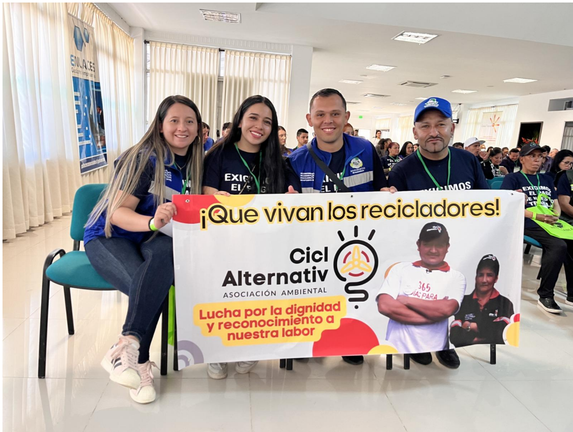
Fotografía 11. Asistencia al segundo Encuentro Internacional de Reciclaje .