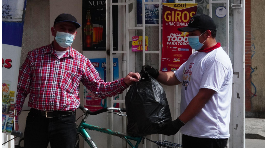
Fotografía 3. Fortalecimiento y acompañamiento a rutas de aprovechamiento.