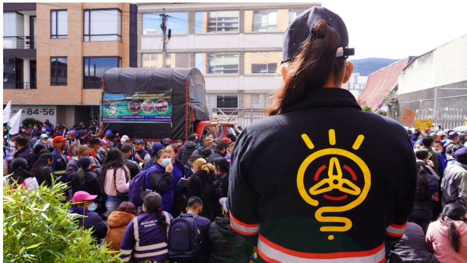
Fotografía 5. Participación en plantón en la SSPD sobre aplazamientos.