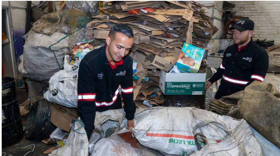
Fotografía 10. Proceso clasificación ECA PRINCIPAL.