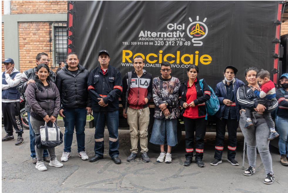
Fotografía 4. Proceso de verificación de RUOR ante la UAESP.