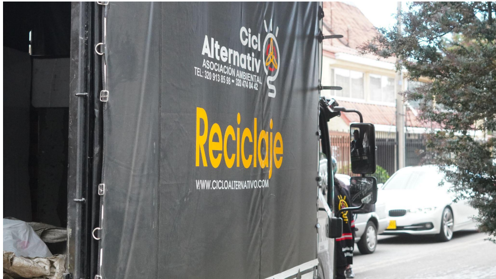
Fotografía 7. Identificación y marcación de vehículos prestadores del servicio de aprovechamiento de la asociación.