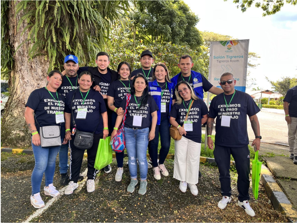
Fotografía 12. Asistencia al segundo Encuentro Internacional de Reciclaje .