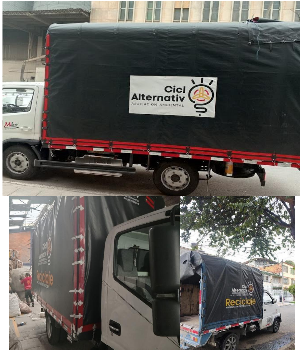
Imagen 10. Fotografía marcación vehículos Ciclo Alternativo.

ASOCIACION AMBIENTAL CICLO ALTERNATIVO NIT: 901.413.938-4