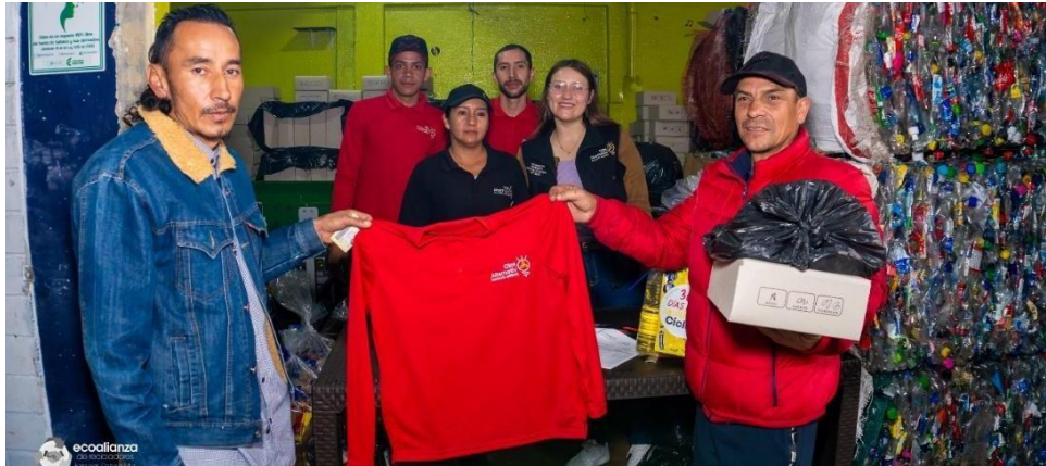
Imagen 5. Fotografía entrega de uniformes segundo semestre 2023

Durante el último mes del año 2023 se realizó entrega de elementos de protección personal como guantes, gafas de protección y tapabocas, también se entregó dotación de trabajo con la identificación de la asociación, mejorando las condiciones laborales de nuestros asociados.