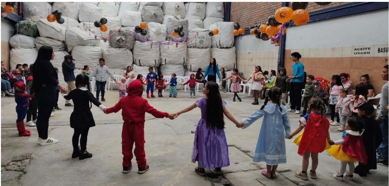
Imagen 2. Fotografía evento Halloween

La asociación realizó una jornada de entrega de obsequios y un espacio de recreación con diferentes actividades a los hijos/as y algunos nietos/as de nuestros asociados, esto por la celebración del día de los niños