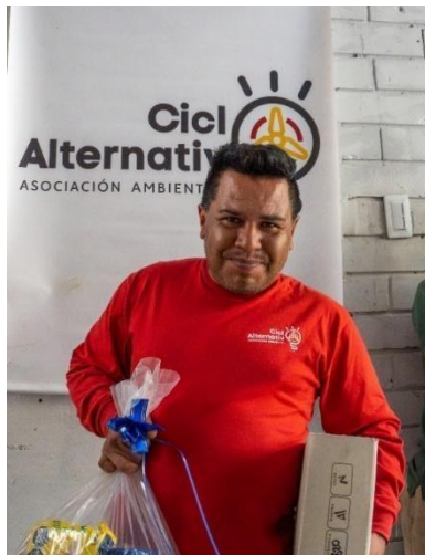
Imagen 6. Fotografía entrega de uniformes segundo semestre 2023