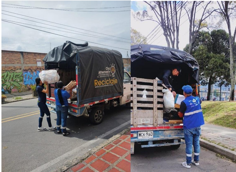
Imagen 9. Fotografías fortalecimiento y acompañamiento a rutas de aprovechamiento