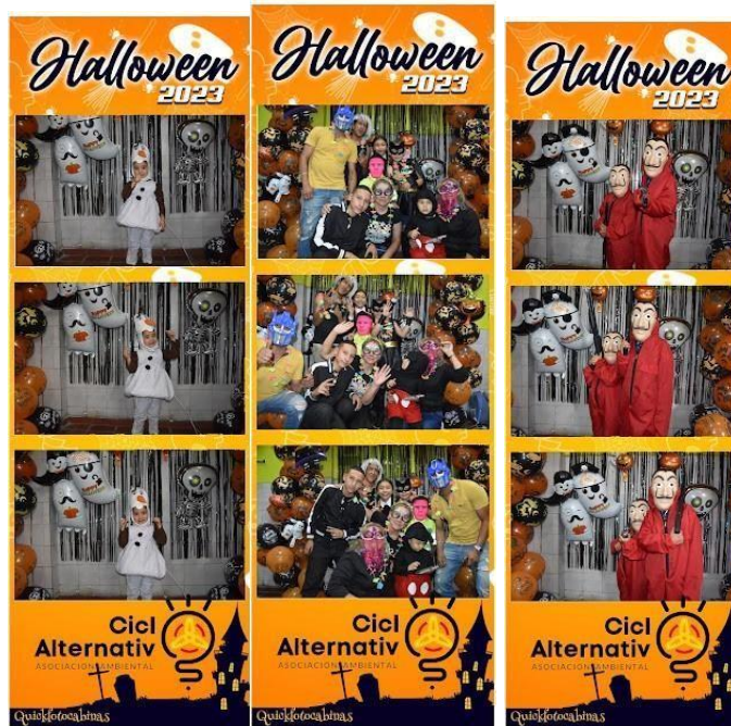
Imagen 4. Fotografía evento Halloween

Durante el evento se tomó una fotografía y se entregó de inmediato a los recicladores de oficio