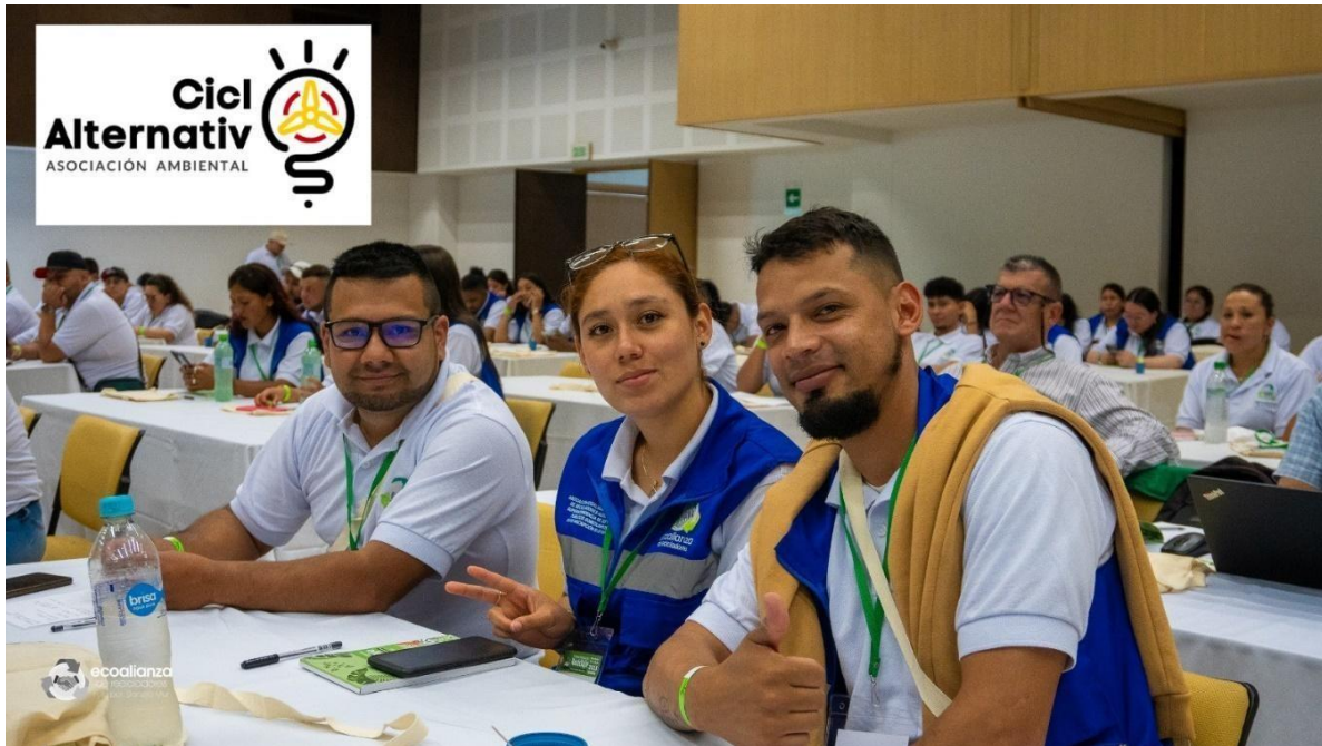
Imagen 11. Asistencia a Tercer Encuentro Internacional de Reciclaje