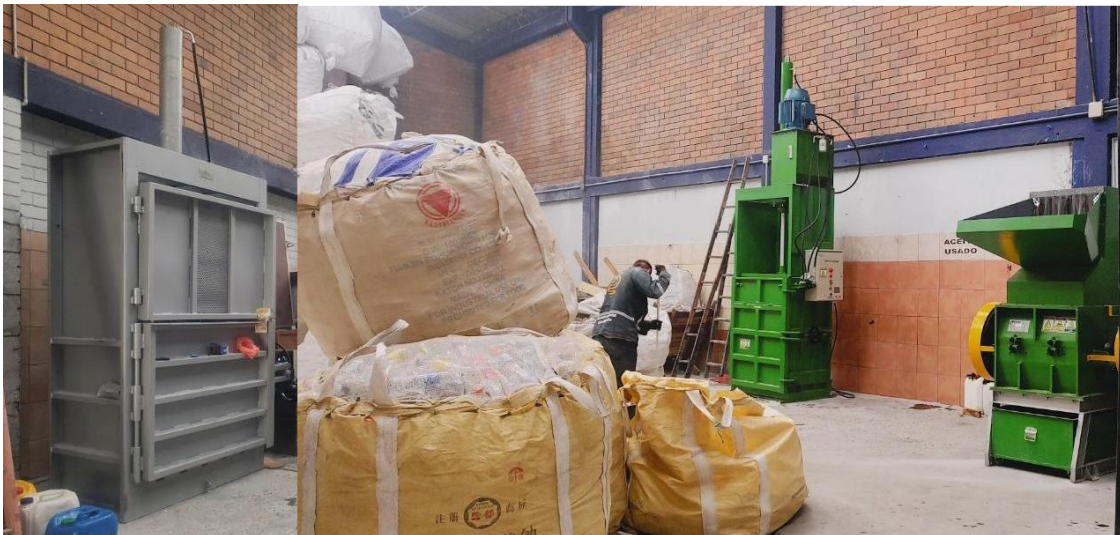
Imagen 12. Maquinaria adquirida por medio de convocatorias