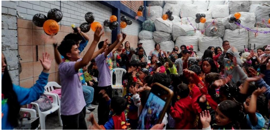
Imagen 3. Fotografía evento Halloween

Durante el evento se tomó una fotografía y se entregó de inmediato a los recicladores de oficio