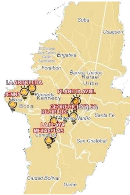
Imagen 1. Ubicación ECAs Ciclo Alternativo